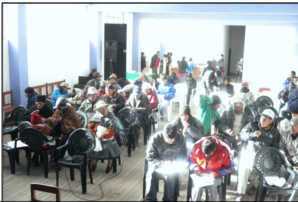
Foto N° 4: Taller de Participación Ciudadana en la C.C. de Sacrafamilia – EIA del Proyecto de Línea de Transmisión 220 KV S.E. Paragsha II -S.E. Francoise del Subsector de Electricidad