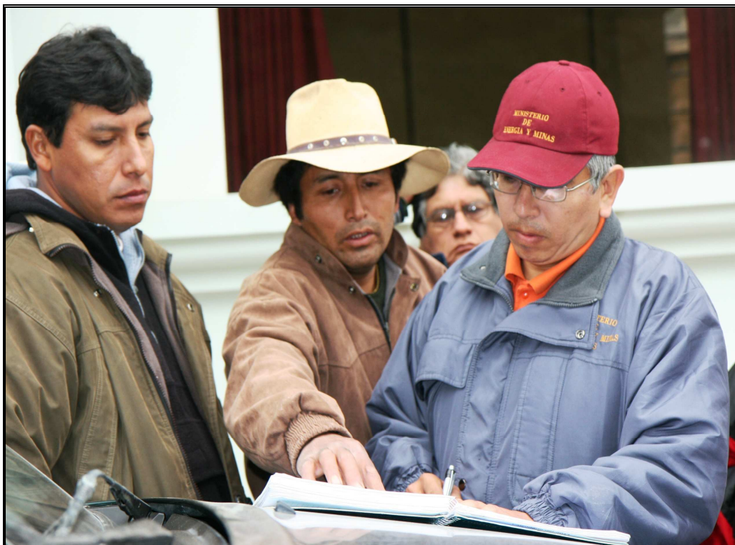
Foto Nº 01: Personal de la OGGs en una visita a la Comunidad Campesina de Huambo – Arequipa