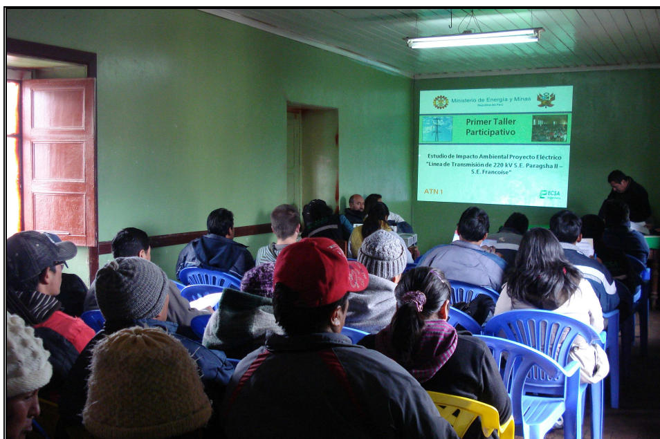
Foto N° 03: Taller Participativo en la C.C. San Antonio de Rancas – EIA del Proyecto de Línea de Transmisión 220 KV S.E. Paragsha II -S.E. Francoise del Subsector de Electricidad