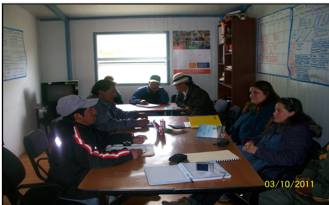
Foto Nº 02: Personal de la OGGs en una reunión con autoridades de la Comunidad Campesina de Fuerabamba – Apurímac.